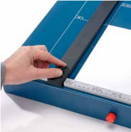
Verstellbarer Metall-Rückanschlag mit Schraubbefestigung zur schnellen Formatfindung - auf beiden Winkelanlagen einsetzbar