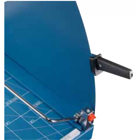
Messerschutzblech für beruhigende Sicherheit beim Schneiden