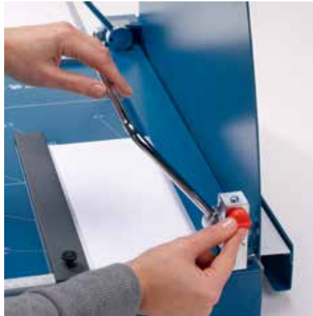
Arretierbare Bügelpressung sorgt für eine optimale Fixierung des Schnittgutes